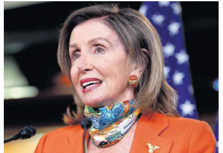
In this June 26, 2020, file photo, House Speaker Nancy Pelosi of Calif., speaks at a news conference on Capitol Hill in Washington.

"We are seeing lots of unique variations on masks, including personalization with names and mono-